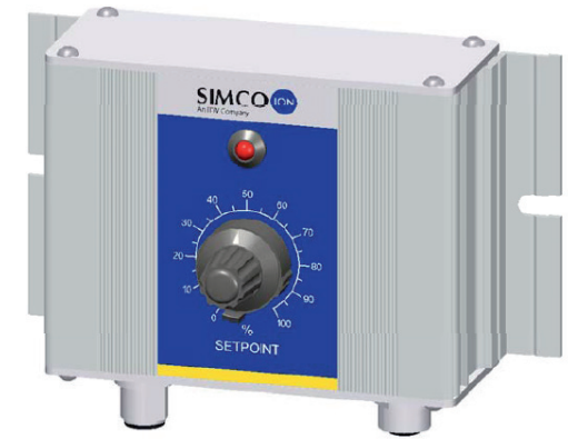
External control unit opzionale