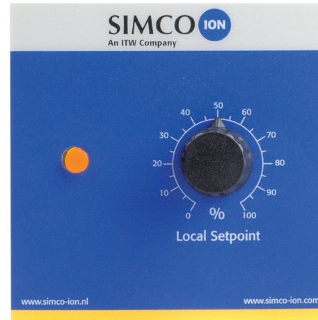
External control kit opzionale