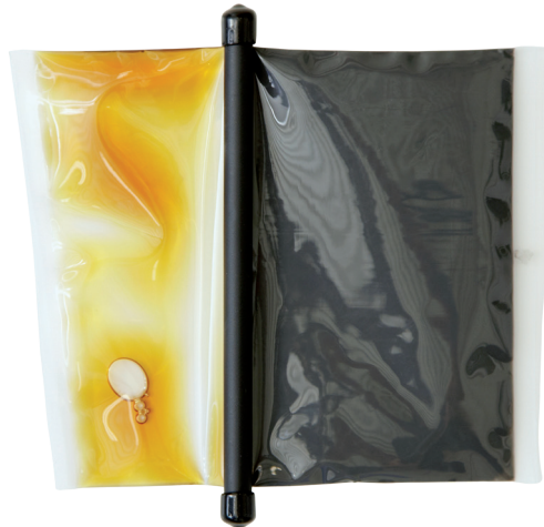
IML Easycore Zweikomponentenharz